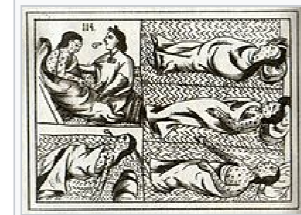
Sixteenth-century Aztec drawings of victims of smallpox (above) and measles (below)

Soon after Europeans and enslaved Africans arrived in the New World, bringing with them the infectious diseases of Europe and Africa, observers noted immense numbers of indigenous Americans began to die from these diseases. One reason this death toll was overlooked is that once introduced, the diseases raced ahead of European immigration in many areas. Disease killed a sizable portion of the populations before European written records were made. After the epidemics had already killed massive numbers of natives, many newer European immigrants assumed that there had always been relatively few indigenous peoples. The scope of the epidemics over the years was tremendous, killing millions of people—possibly in excess of 90% of the population in the hardest hit areas—and creating one of "the greatest human catastrophe in history, far exceeding even the disaster of the Black Death of medieval Europe", [23] which had killed up to one-third of the people in Europe and Asia between 1347 and 1351.