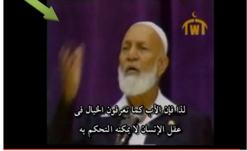
مناظرة أحمد ديدات و جيمى سواجرت مترجمة لأول مرة الجزء الثانى